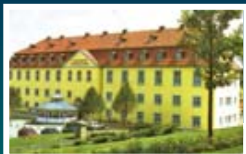
Großer Gasthof Ballenstedt