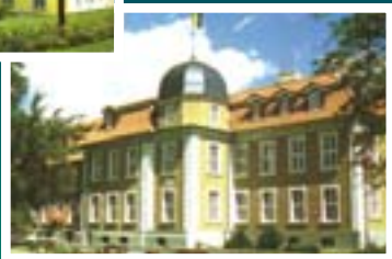
Parkhotel Schloß Meisdorf

Die Van der Valk Schloßhotels im Harz bitten modernsten Komfort in einem fürstlichen Ambiente.